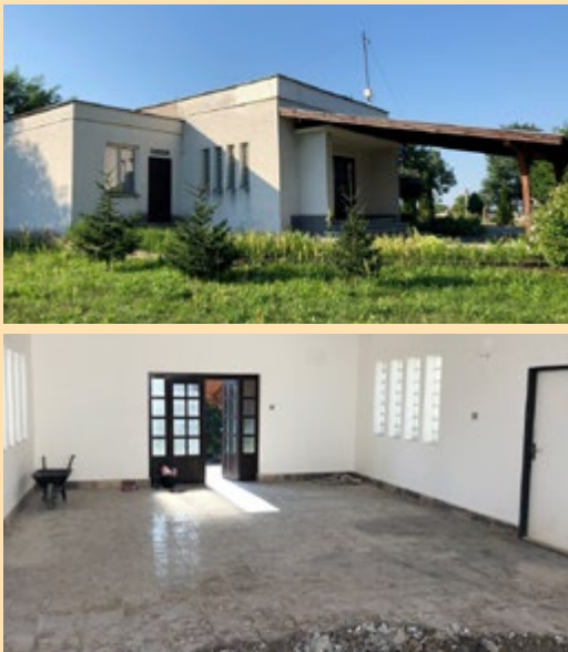
Fotografia pred realizáciou projektu